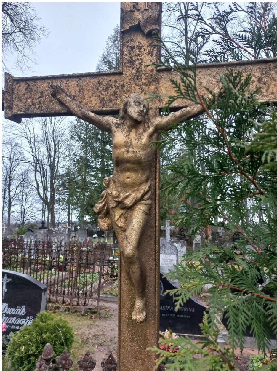
Fot. nr 5. Nagrobek Anny z Ryków Benisławskiej z cmentarza katolickiego w Krasławiu, Łotwa. Fragment z przedstawieniem Chrystusa.