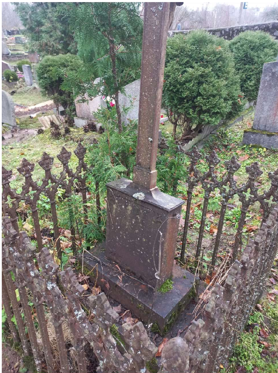
Fot. nr 4. Nagrobek Anny z Ryków Benisławskiej z cmentarza katolickiego w Krasławiu, Łotwa. Widoczny fragment podstawy, cokołu, ogrodzenia, tył.