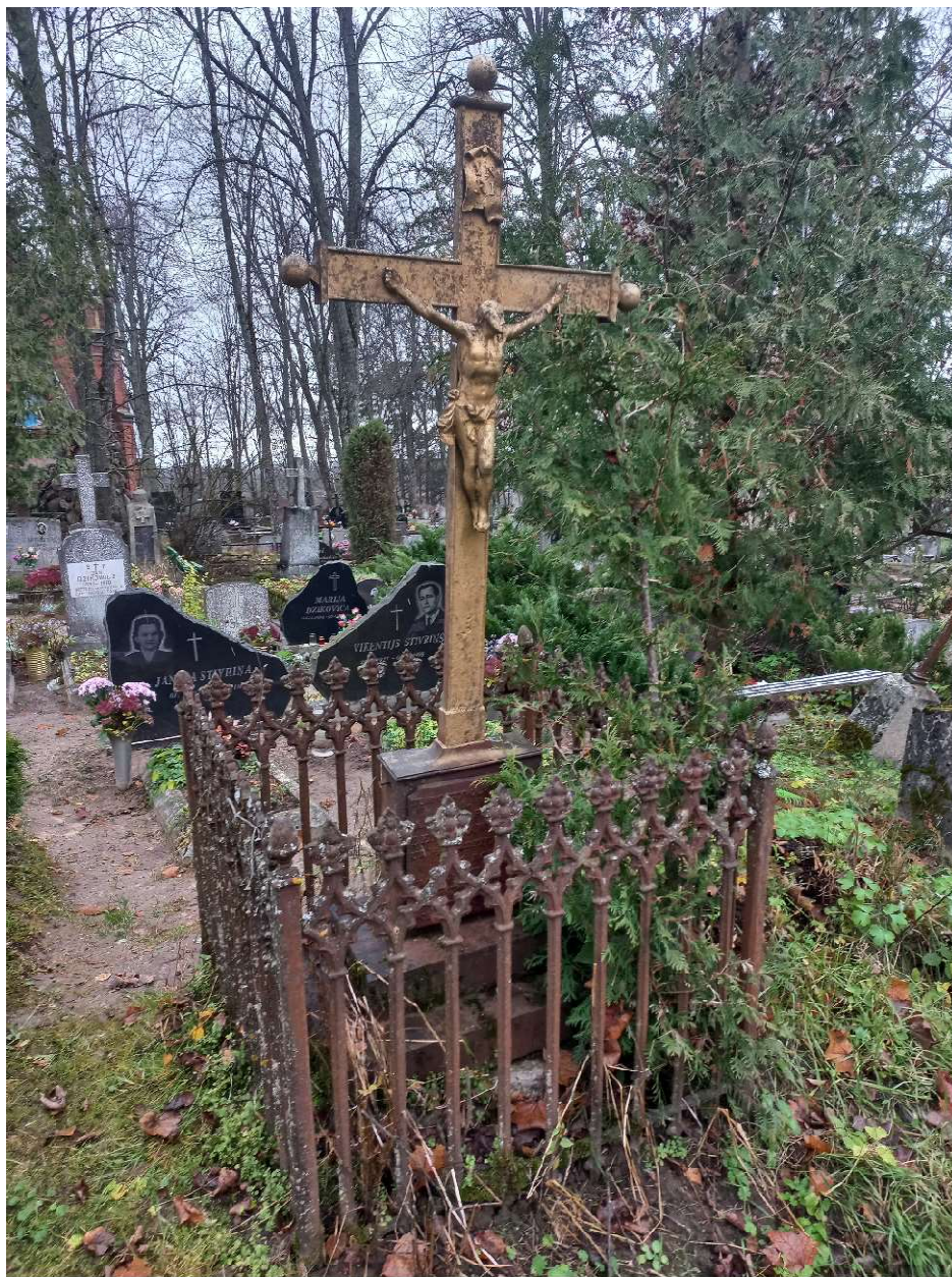
Fot. nr 2. Nagrobek Anny z Rycków Benisławskiej z cmentarza katolickiego w Krasławiu, Łotwa. Widok ogólny, front.