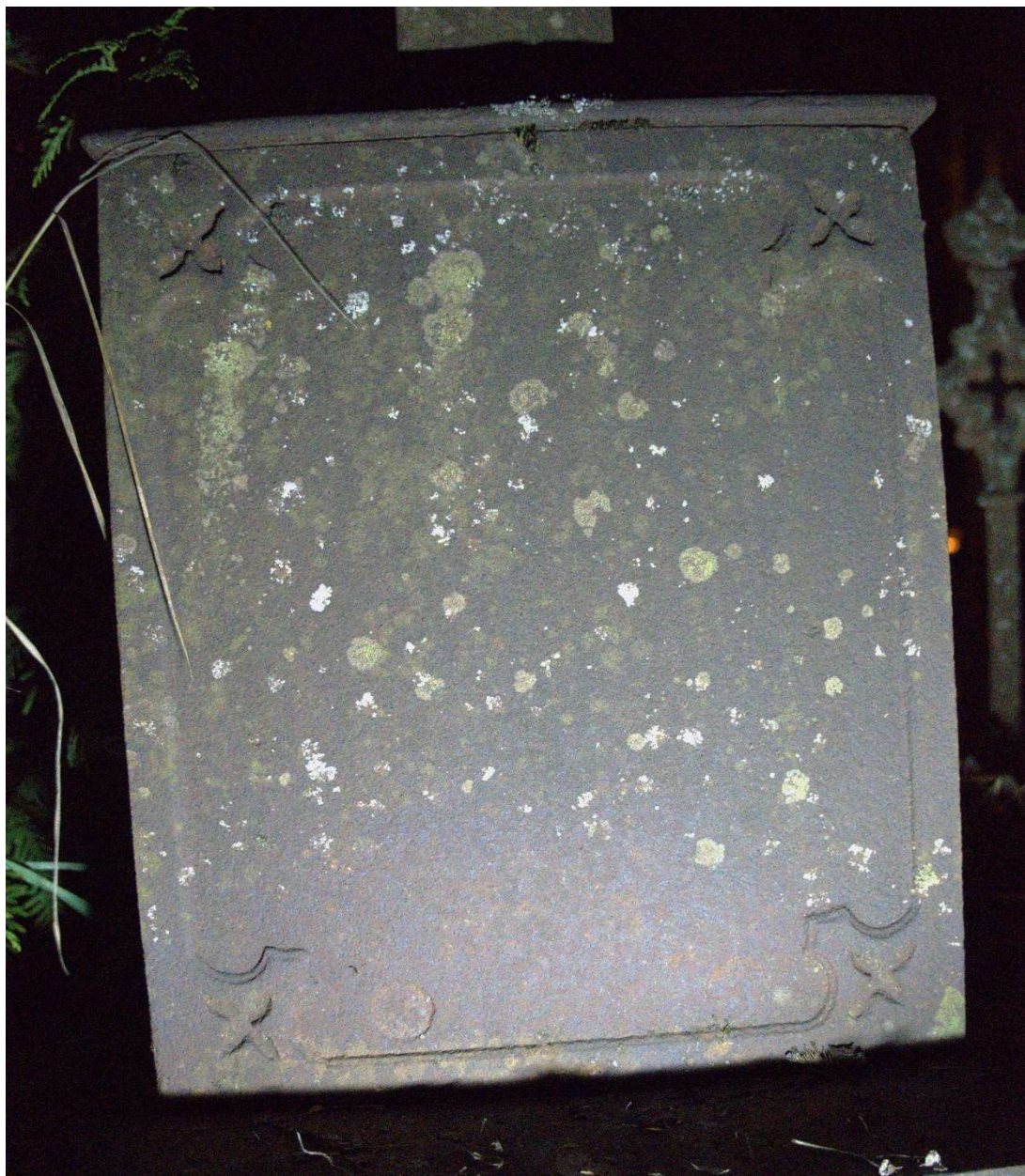
Fot. nr 9. Nagrobek Anny z Ryków Benisławskiej z cmentarza katolickiego w Krasławiu, Łotwa. Widoczna tylna ścianka cokołu.