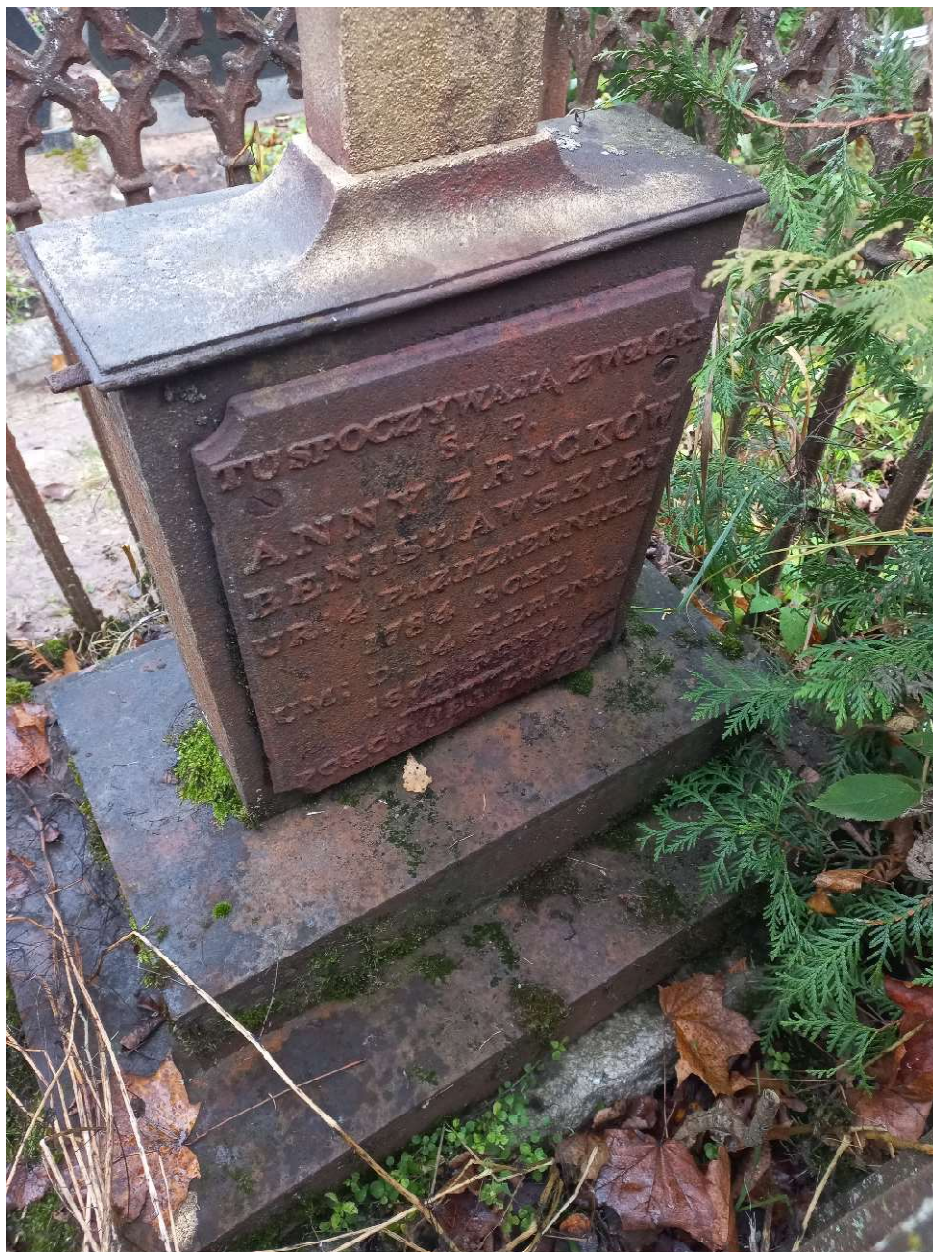
Fot. nr 7. Nagrobek Anny z Ryków Benisławskiej z cmentarza katolickiego w Krasławiu, Łotwa. Widoczny fragment podstawy, cokołu, ogrodzenia, przód.