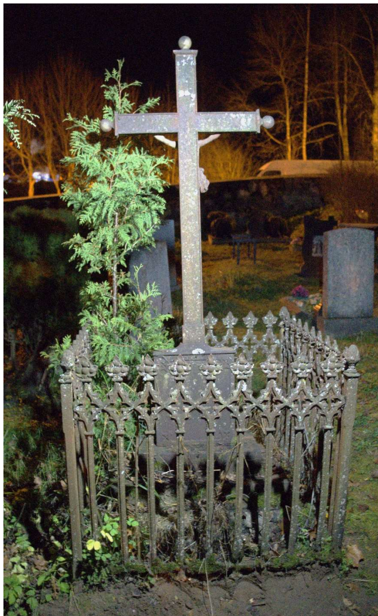
Fot. nr 3. Nagrobek Anny z Rycków Benisławskiej z cmentarza katolickiego w Krasławiu, Łotwa. Widok ogólny, tył.