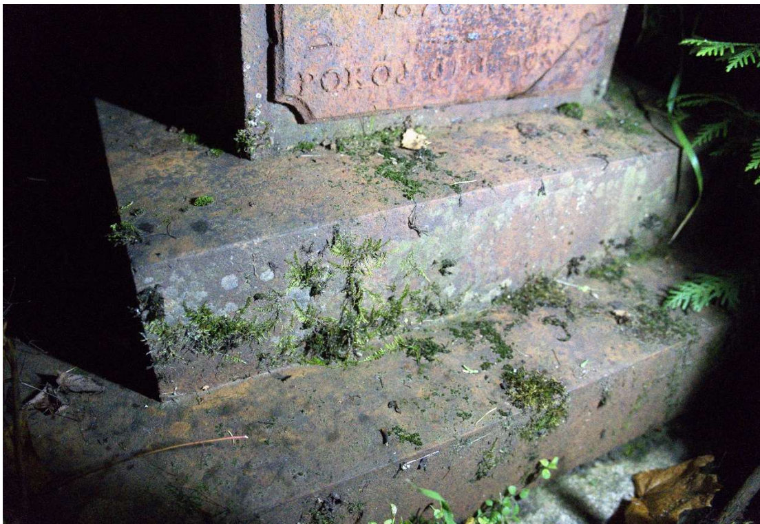
Fot. nr 10. Nagrobek Anny z Rycków Benisławskiej z cmentarza katolickiego w Krasławiu, Łotwa. Widoczny fragment stopni podstawy, front.