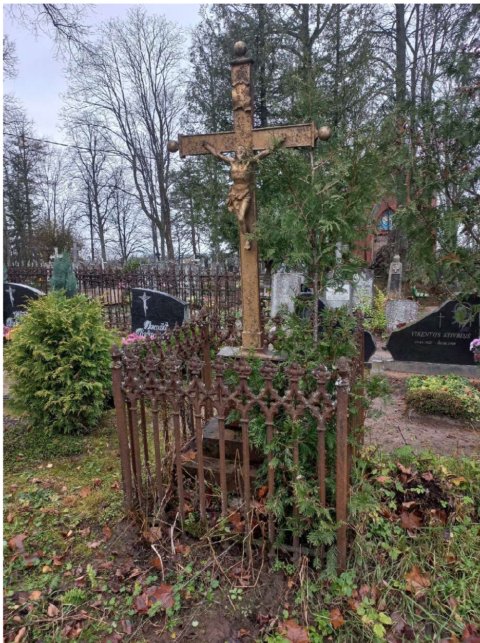
Fot. nr 1. Nagrobek Anny z Rycków Benisławskiej z cmentarza katolickiego w Krasławiu, Łotwa. Widok ogólny, front.