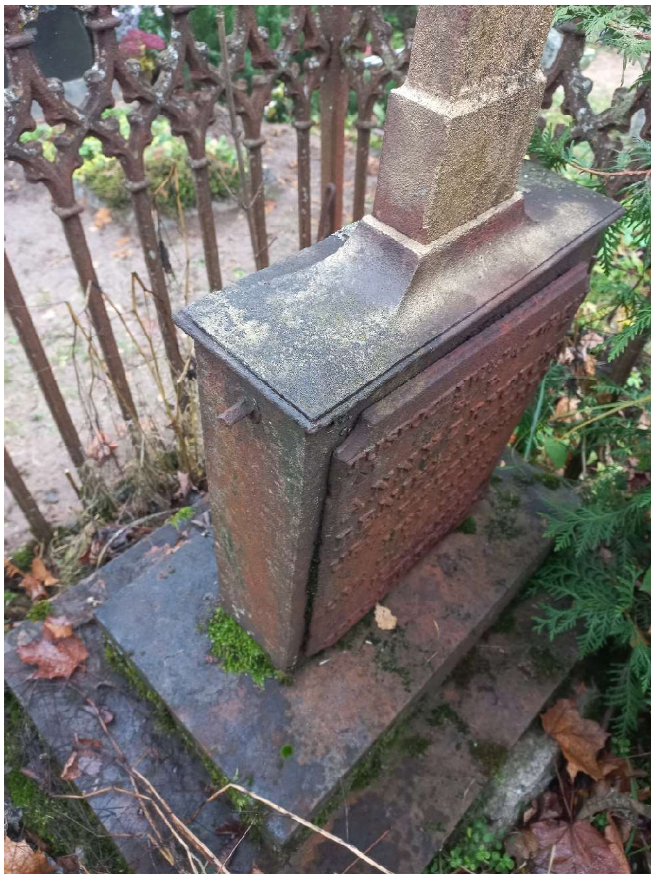
Fot. nr 6. Nagrobek Anny z Rycków Benisławskiej z cmentarza katolickiego w Krasławiu, Łotwa. Widoczny fragment podstawy, cokołu, ogrodzenia, przód.