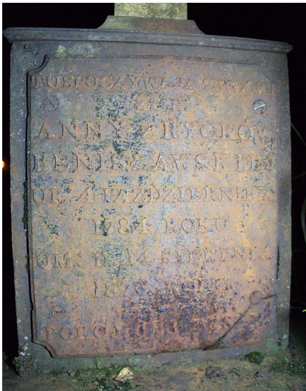
Fot. nr 8. Nagrobek Anny z Ryków Benisławskiej z cmentarza katolickiego w Krasławiu, Łotwa. Widoczny fragment z tablicą inskrypcyjną, front.