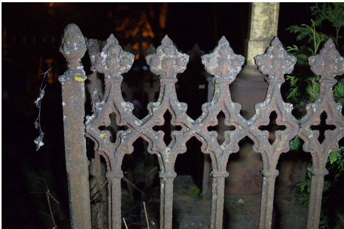
Fot. nr 11. Nagrobek Anny z Rycków Benisławskiej z cmentarza katolickiego w Krasławiu, Łotwa. Widoczny fragment ogrodzenia, tył.