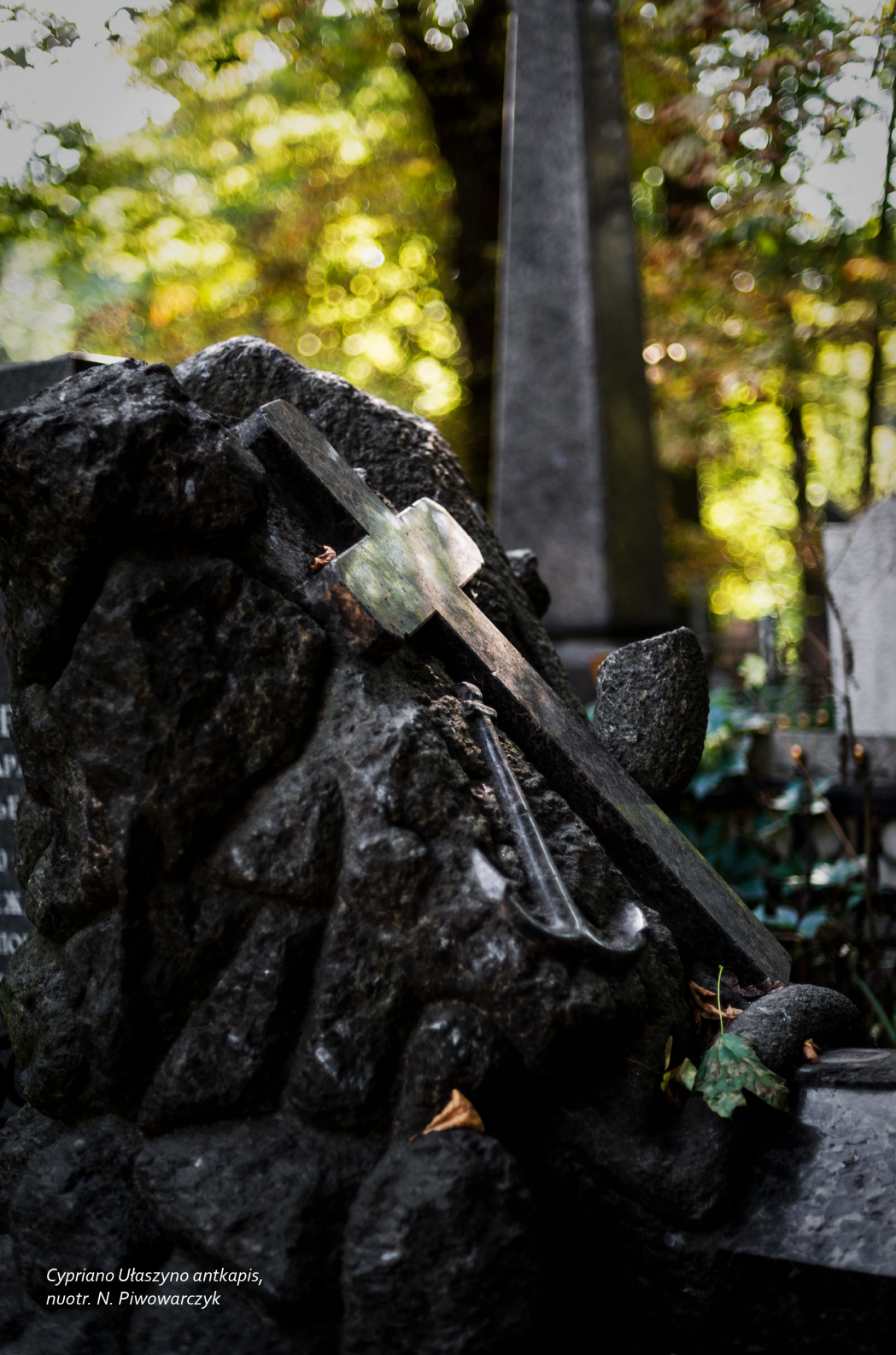
Cypriano Ułaszyno antkapis

Kapinėse išliko keli šimtai antkapinių paminklų su lenkiškais užrašais.