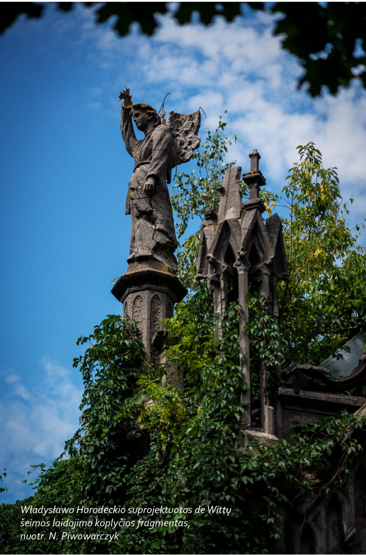
Władysławo Horodeckiego suprojektuotas de Wittu šeimos laidojimo koplyčios fragmentas, nuotr. N. Piwowarczyk