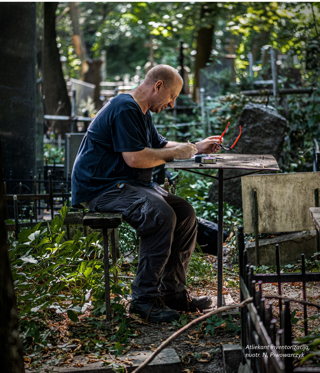
Atliekant inventurizaciją