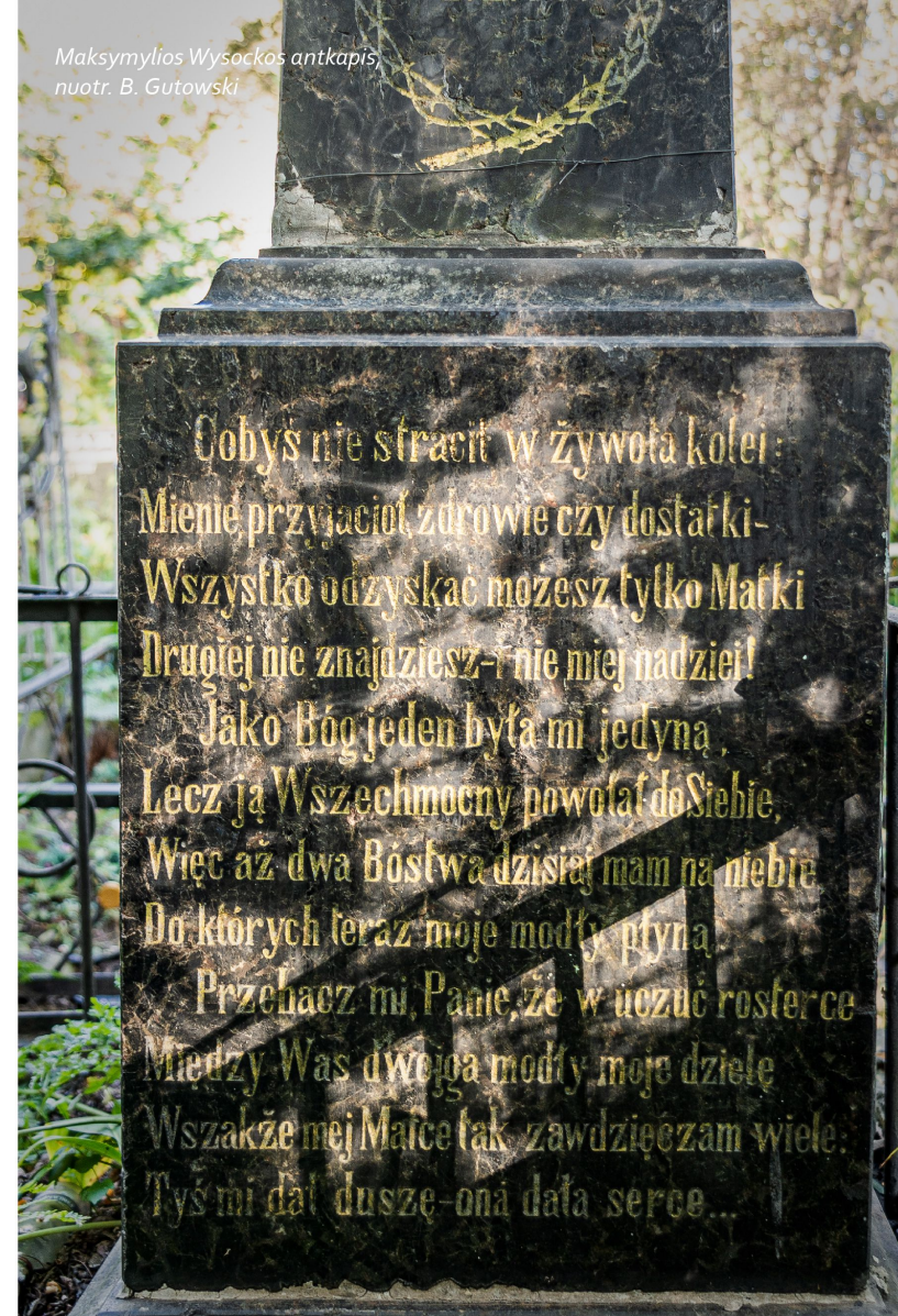
Maksymylios Wysockos antkapis