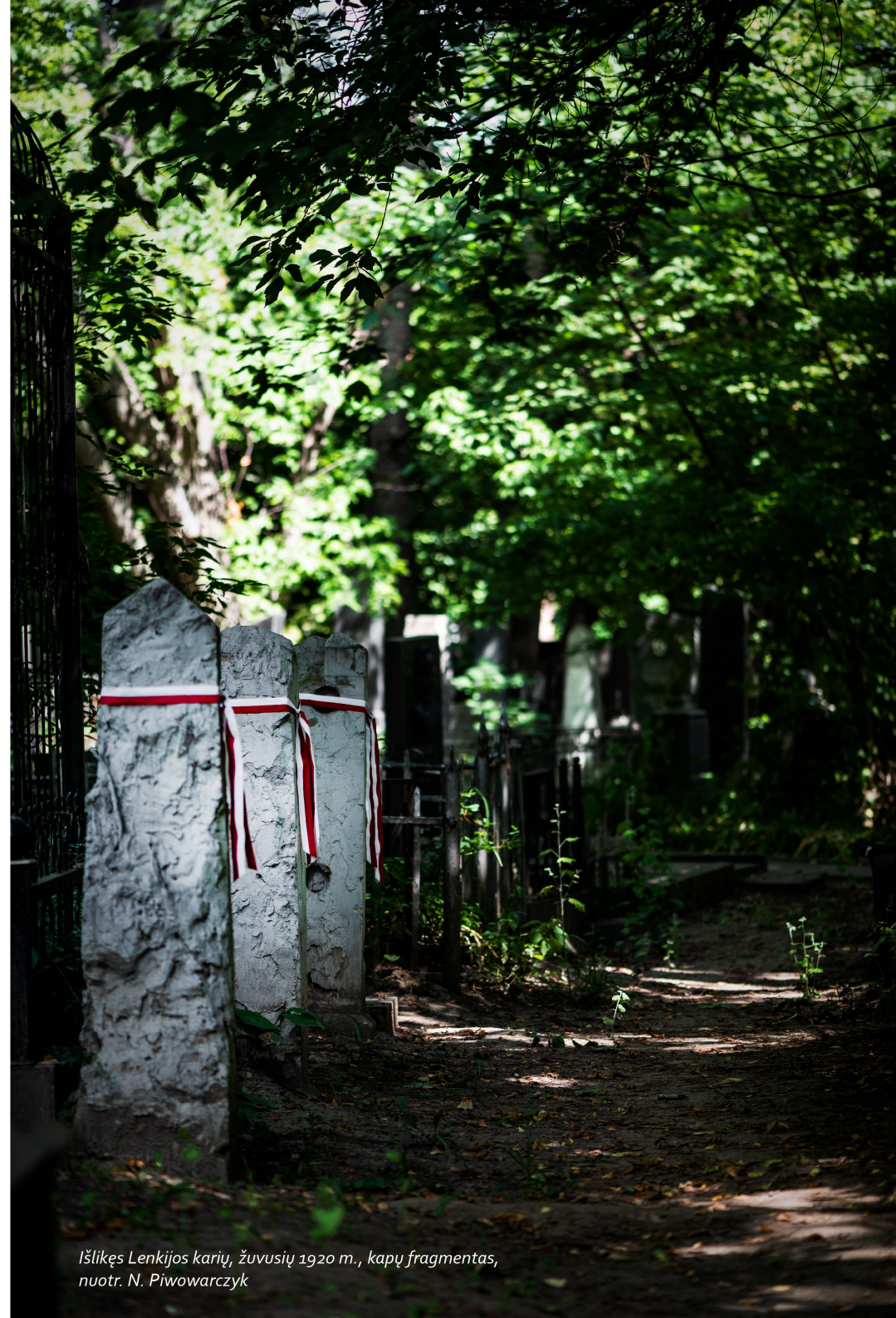
Išlikęs Lenkijos karių, žuvusių 1920 m., kapų fragmentas