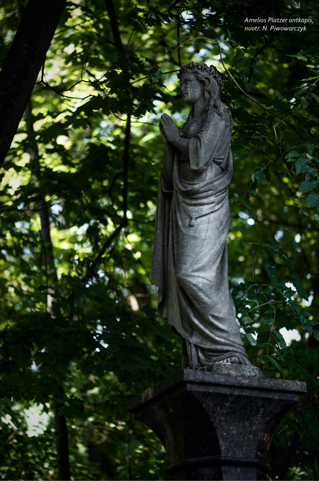
Amelios Platzer antkapis