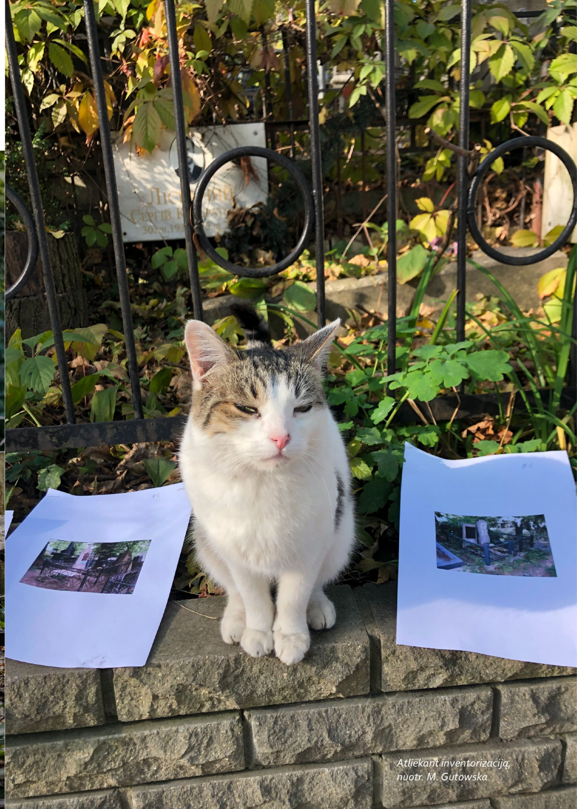
Atliekant inventurizaciją