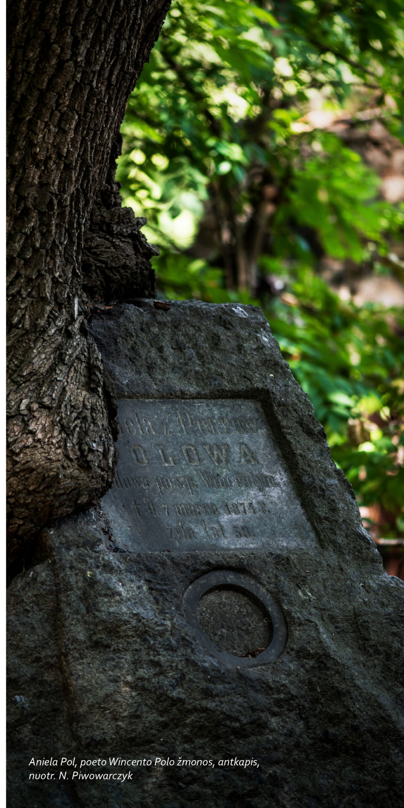
Aniela Pol, poeto Wincento Polo žmonos, antkapis

Garbingą motiną su liūdesiu / didžiu palydi amžiams / prašyki Dievo užtarimo jai, / praeivi, meldžia Tavęs josios vaikai.