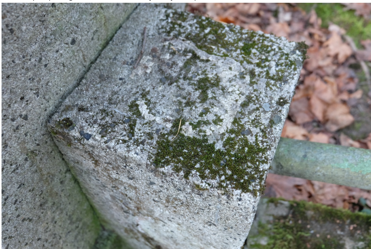
Fot. 8. Nagrobek Władysława Czerwniewskiego z cmentarza św. Michała w Rydze, na Łotwie. Widoczne nawarstwienia biologiczne i ślad po utraconym elemencie słupka. Listopad 2020 r.