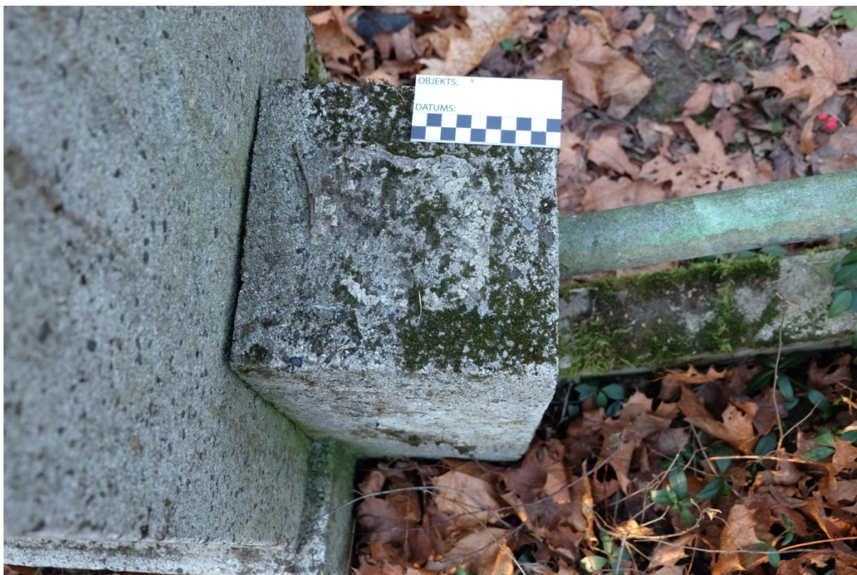
Fot. 7. Nagrobek Władysława Czerwniewskiego z cmentarza św. Michała w Rydze, na Łotwie. Widoczny słupek ogrodzenia z metalową rurką. Listopad 2020 r.