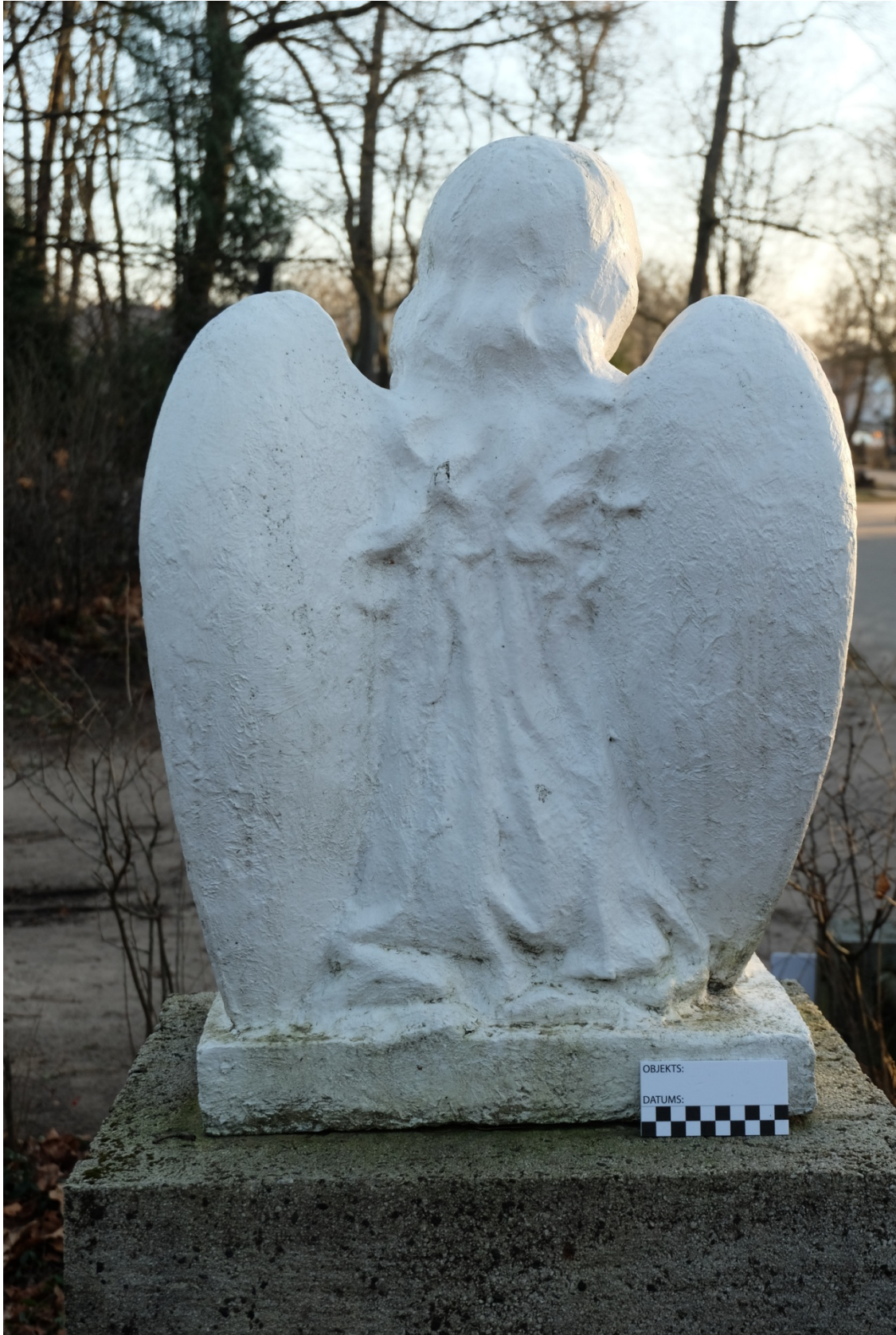
Fot. 6. Nagrobek Władysława Czerwniewskiego z cmentarza św. Michała w Rydze, na Łotwie. Widok rzeźby od zachodu. Listopad 2020 r.