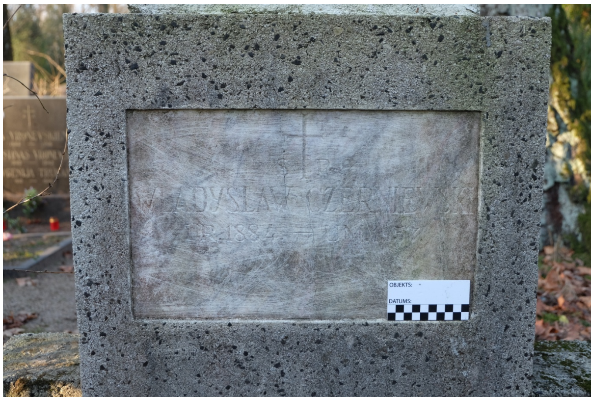
Fot. 9. Nagrobek Władysława Czerwniewskiego z cmentarza św. Michała w Rydze, na Łotwie. Tablica inskrypcyjna. Listopad 2020 r.