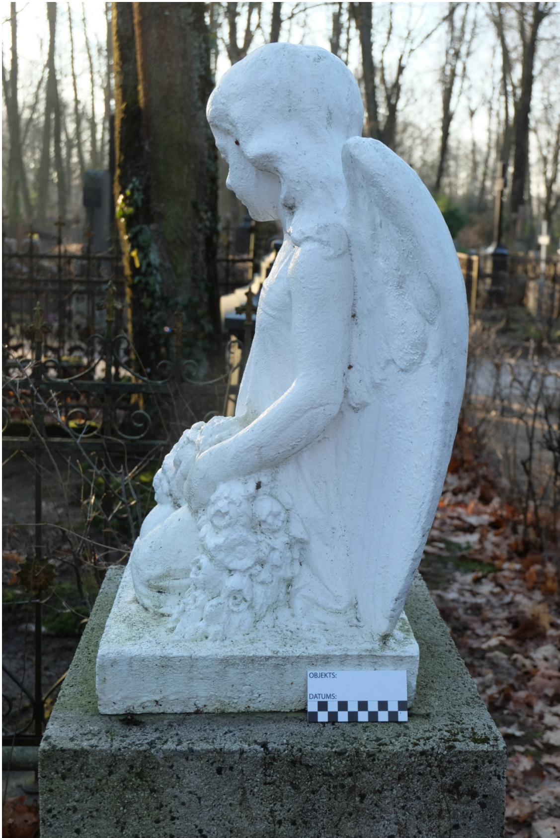
Fot. 4. Nagrobek Władysława Czerwiewskiego z cmentarza św. Michała w Rydze, na Łotwie. Widok rzeźby od północy. Listopad 2020 r.