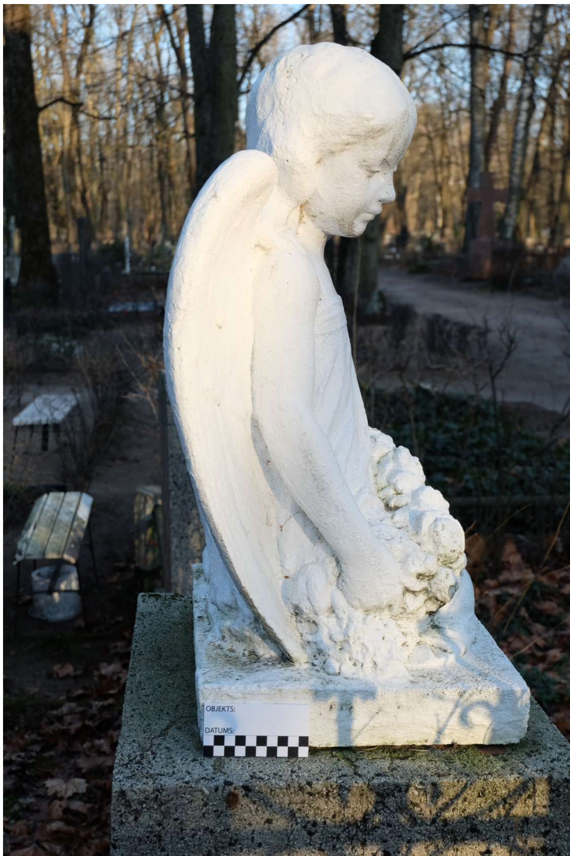
Fot. 5. Nagrobek Władysława Czerwiewskiego z cmentarza św. Michała w Rydze, na Łotwie. Widok rzeźby od południa. Listopad 2020 r.