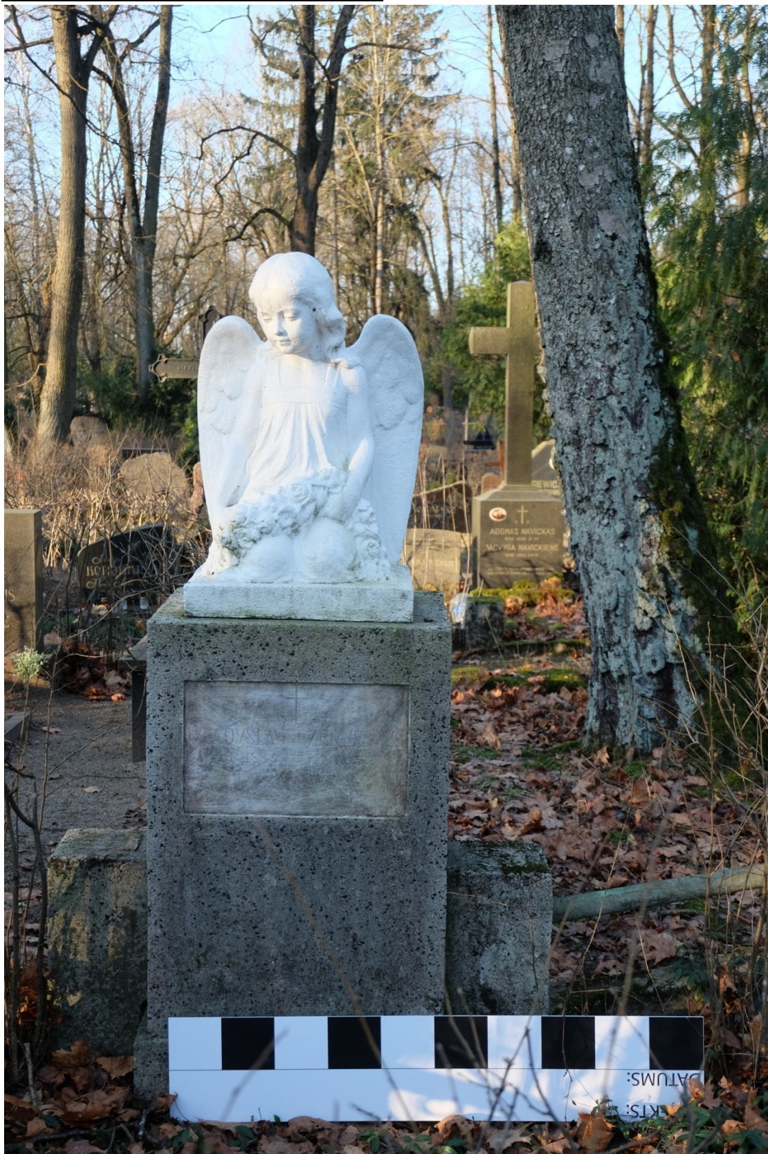
Fot. 1. Nagrobek Władysława Czerwniewskiego z cmentarza św. Michała w Rydze, na Łotwie. Widok ogólny od frontu. Listopad 2020 r.