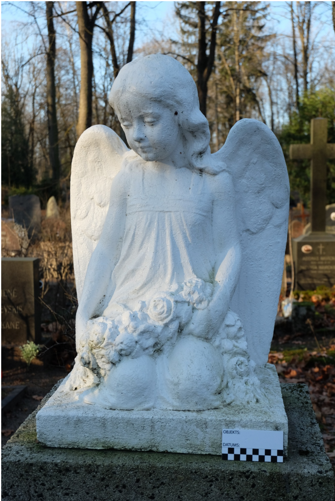
Fot. 3. Nagrobek Władysława Czerwiewskiego z cmentarza św. Michała w Rydze, na Łotwie. Widok rzeźby od wschodu. Listopad 2020 r.