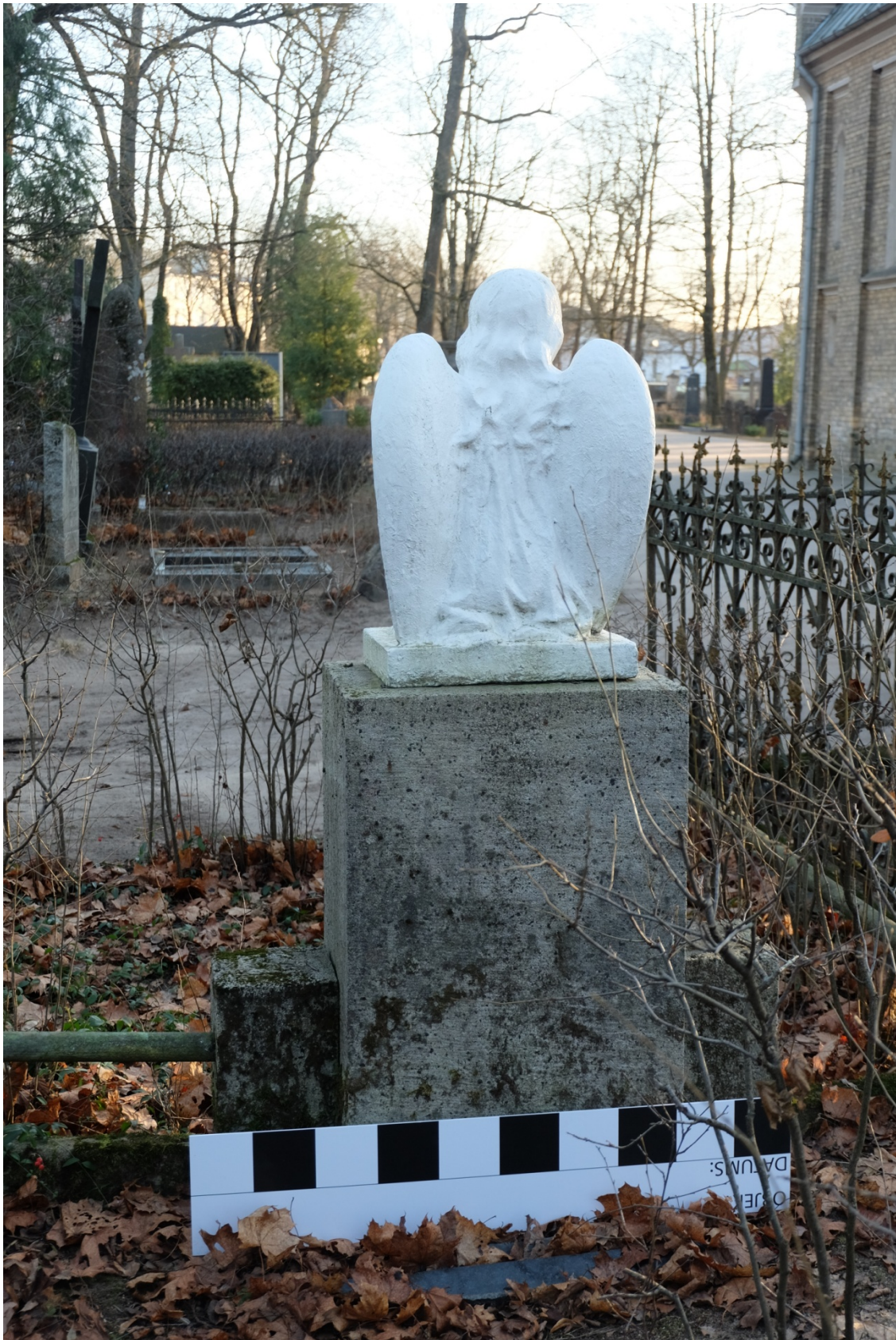
Fot. 2. Nagrobek Władysława Czerwniewskiego z cmentarza św. Michała w Rydze, na Łotwie. Widok ogólny od tyłu. Listopad 2020 r.