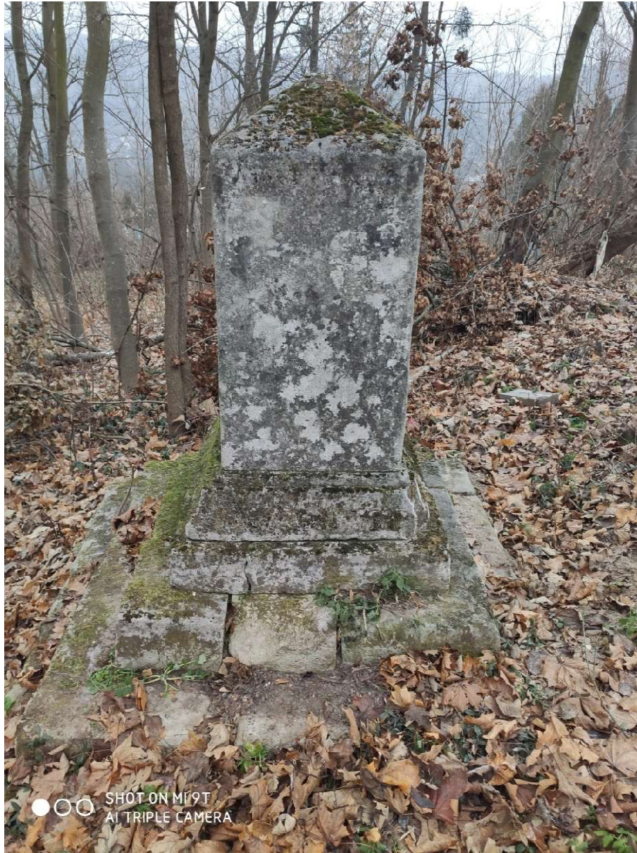
Fot. nr 2. Nagrobek Kamilli Malindowskiej- Cholodeckiej z Cmentarza Bazyliańskiego w Krzemieńcu, Ukraina. Widok ogólny, tył. Stan z grudnia 2020 roku.