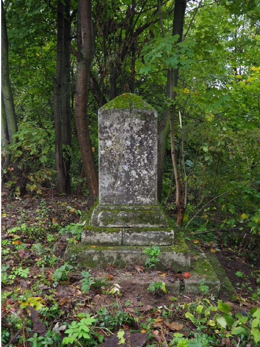
Fot. nr 3. Nagrobek Kamilli Malindowskiej- Cholodeckiej z Cmentarza Bazyliańskiego w Krzemieńcu, Ukraina. Widok ogólny, lewy bok. Stan z października 2020 roku.