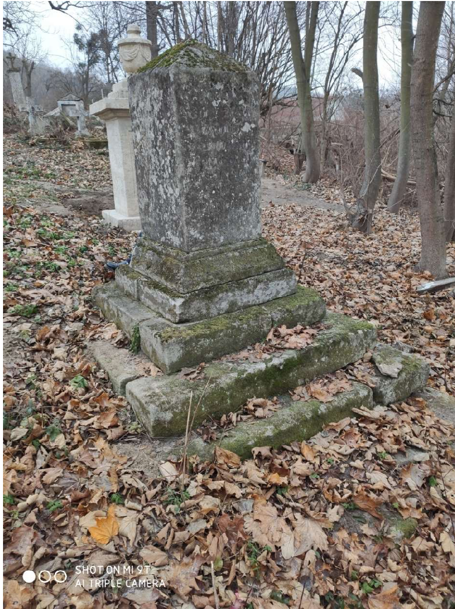
Fot. nr 6. Nagrobek Kamilli Malindowskiej- Cholodeckiej z Cmentarza Bazyliańskiego w Krzemieńcu, Ukraina. Widok ogólny. Stan z października 2020 roku.