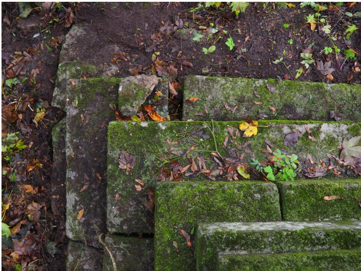
Fot. nr 11. Nagrobek Kamilli Malindowskiej- Cholodeckiej z Cmentarza Bazyliańskiego w Krzemieńcu, Ukraina. Fragment podstawy z prawej strony, widoczne nawarstwienia biologiczne (liczne skupiska mchów) oraz pęknięcia materiału skalnego, przesunięcie płyt. Stan z października 2020 roku.