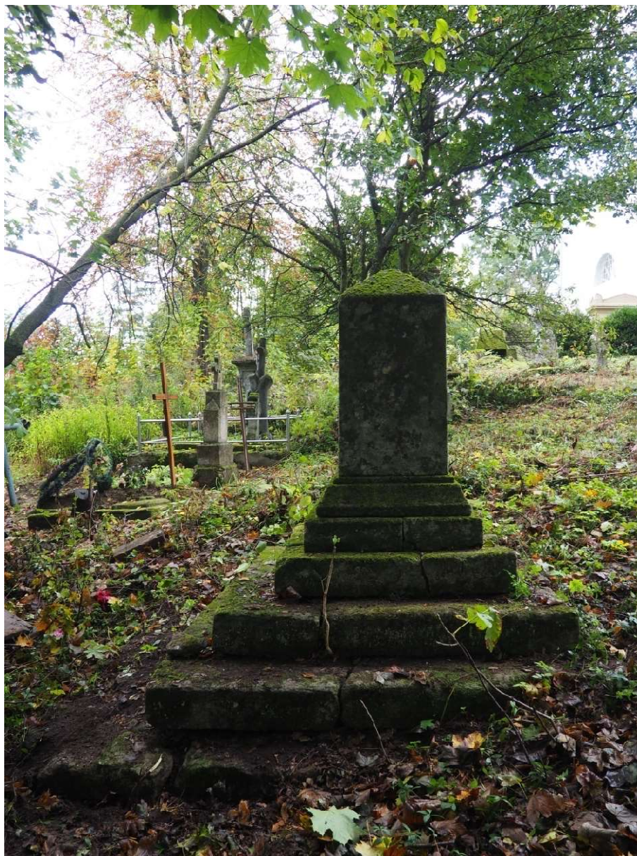
Fot. nr 4. Nagrobek Kamilli Malindowskiej- Cholodeckiej z Cmentarza Bazyliańskiego w Krzemieńcu, Ukraina. Widok ogólny, prawy bok. Stan z października 2020 roku.