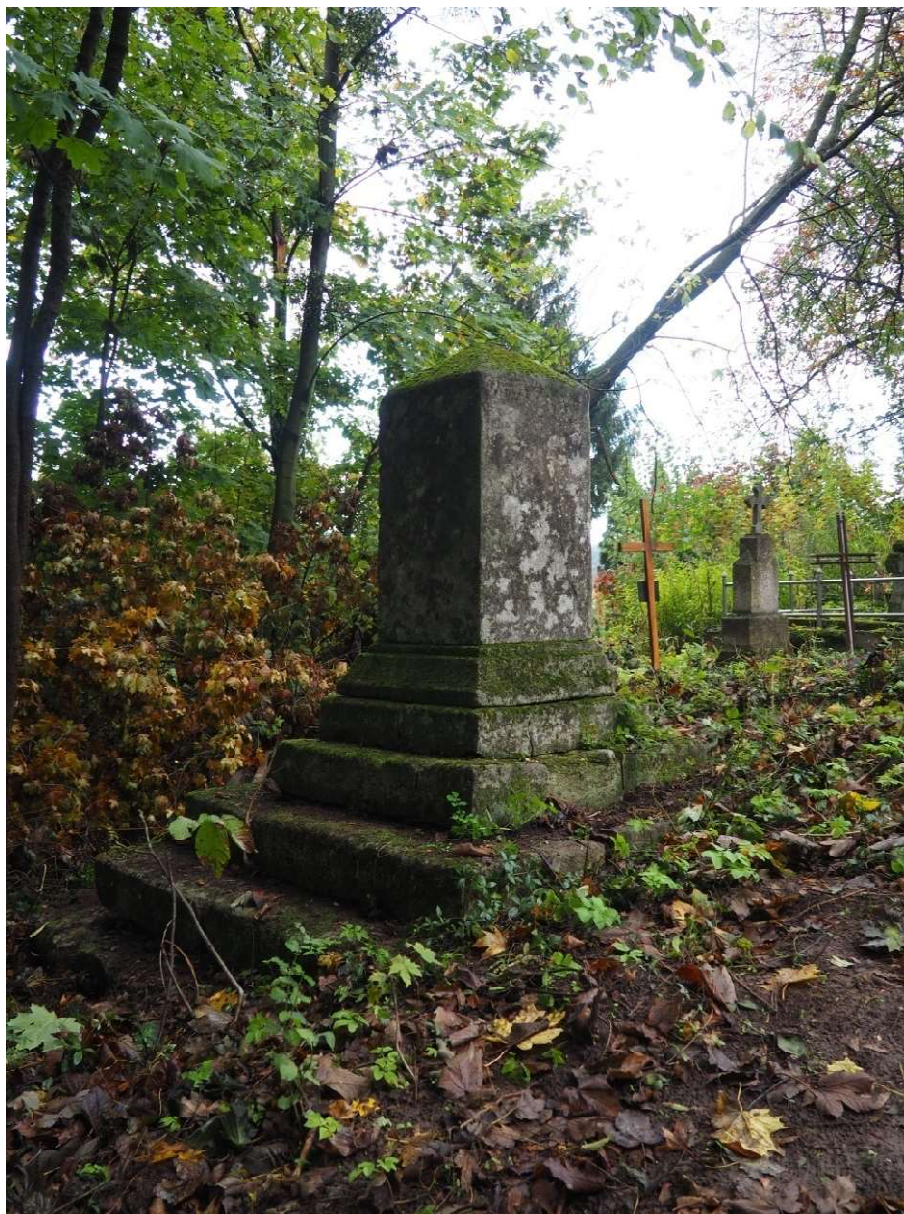
Fot. nr 5. Nagrobek Kamilli Malindowskiej- Cholodeckiej z Cmentarza Bazyliańskiego w Krzemieńcu, Ukraina. Widok ogólny. Stan z października 2020 roku.