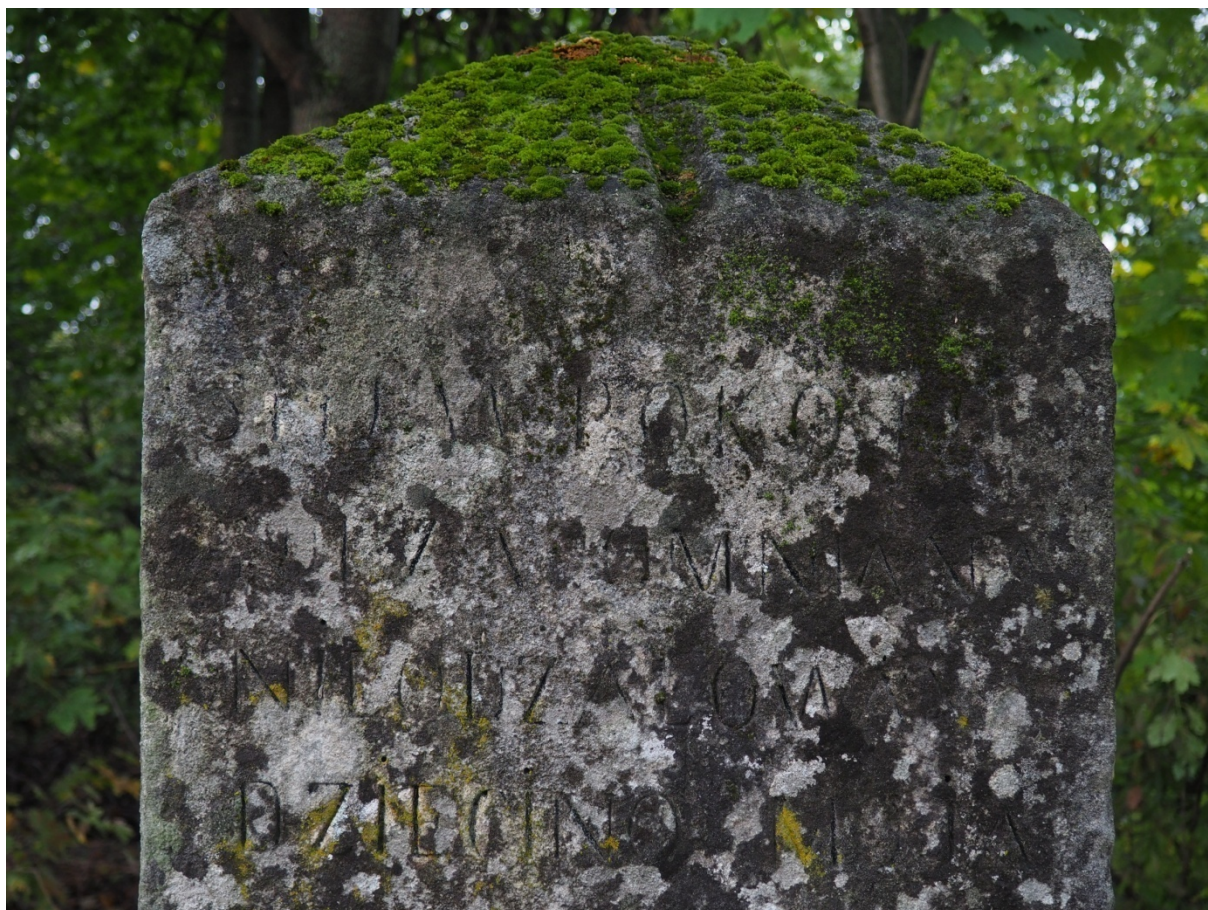
Fot. nr 8. Nagrobek Kamilli Malindowskiej- Cholodeckiej z Cmentarza Bazyliańskiego w Krzemieńcu, Ukraina. Widoczna inskrypcja z lewego boku obelisku. Stan z października 2020 roku.