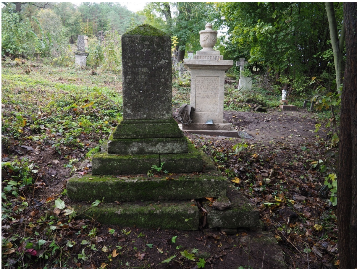
Fot. nr 1. Nagrobek Kamilli Malindowskiej- Cholodeckiej z Cmentarza Bazyliańskiego w Krzemieńcu, Ukraina. Widok ogólny, front. Stan z października 2020 roku.