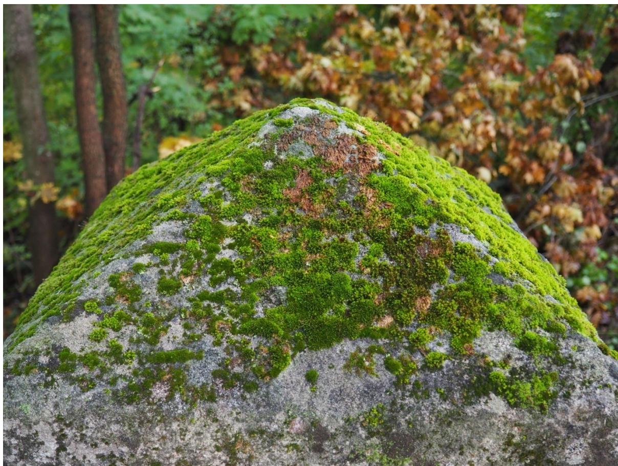
Fot. nr 10. Nagrobek Kamilli Malindowskiej- Cholodeckiej z Cmentarza Bazyliańskiego w Krzemieńcu, Ukraina. Górna część obelisku, widoczne liczne kolonie mchów. Stan z października 2020 roku.