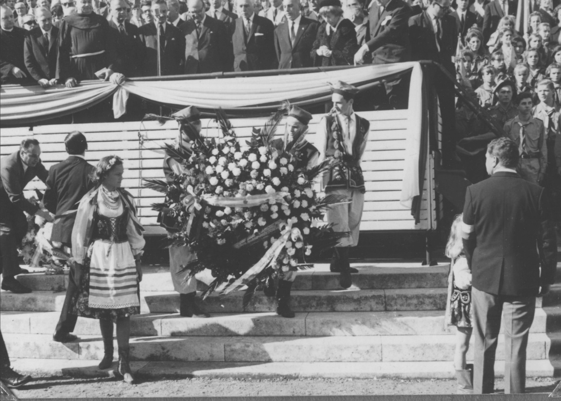
8 maja 1966, Buenos Aires. Obchody Tysiąclecia Chrztu i Państwa Polskiego. Trybuna na Plaza Congreso i dzieci w strojach ludowych z wieńcami.