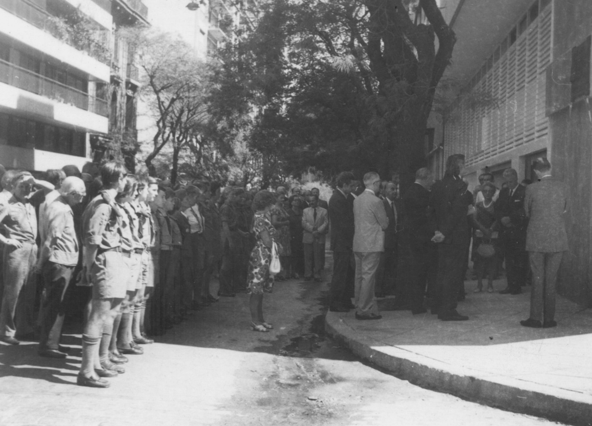
Ok. 1973 (?), Buenos Aires, Argentyna. Uroczystość zorganizowana przez Związek Polaków w Argentynie na ulicy Copernico.