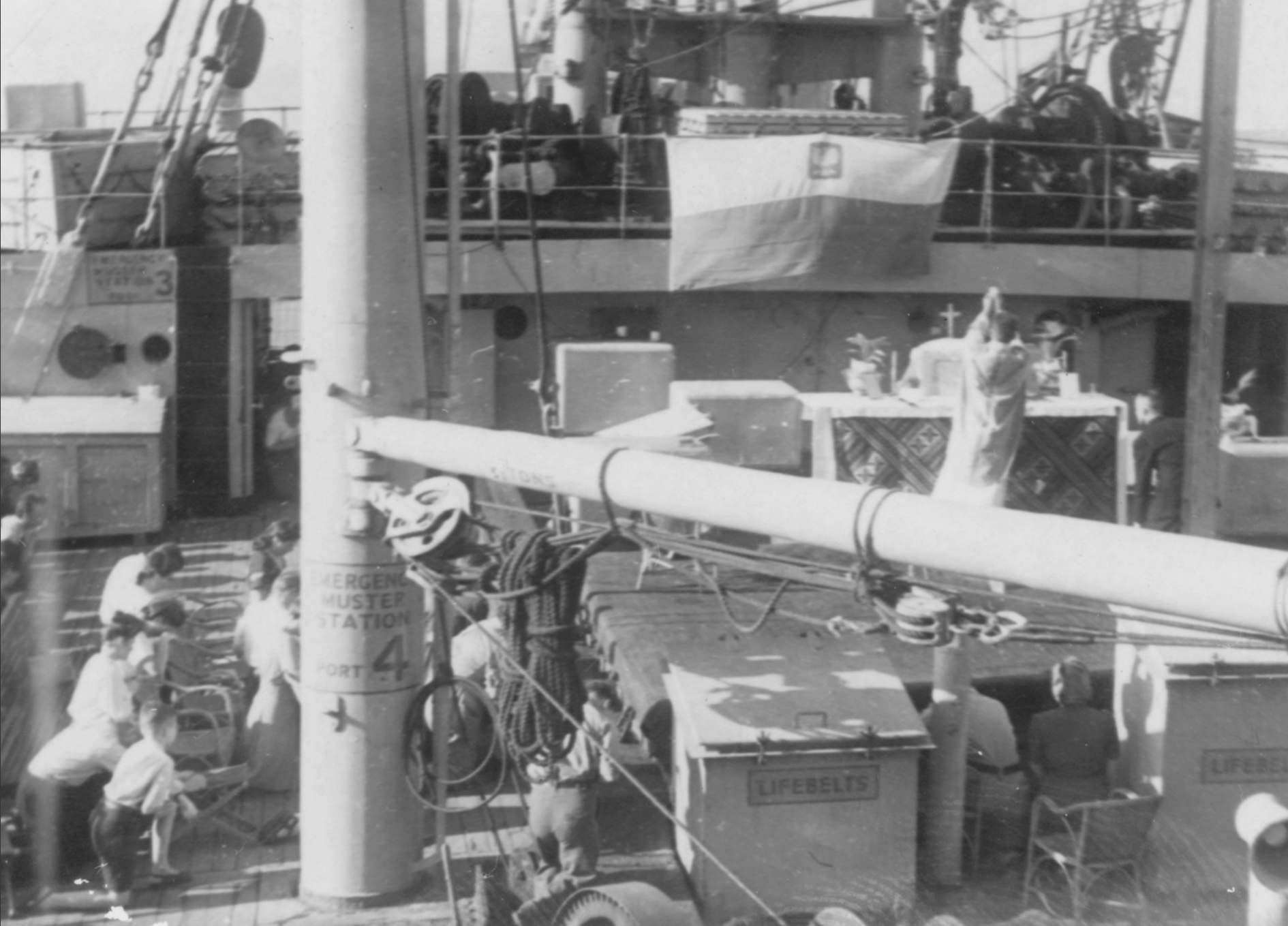
1948, Atlantyck. Rezurekcja na statku Empire Deben, zorganizowana przez Polaków w drodze do Argentyny.