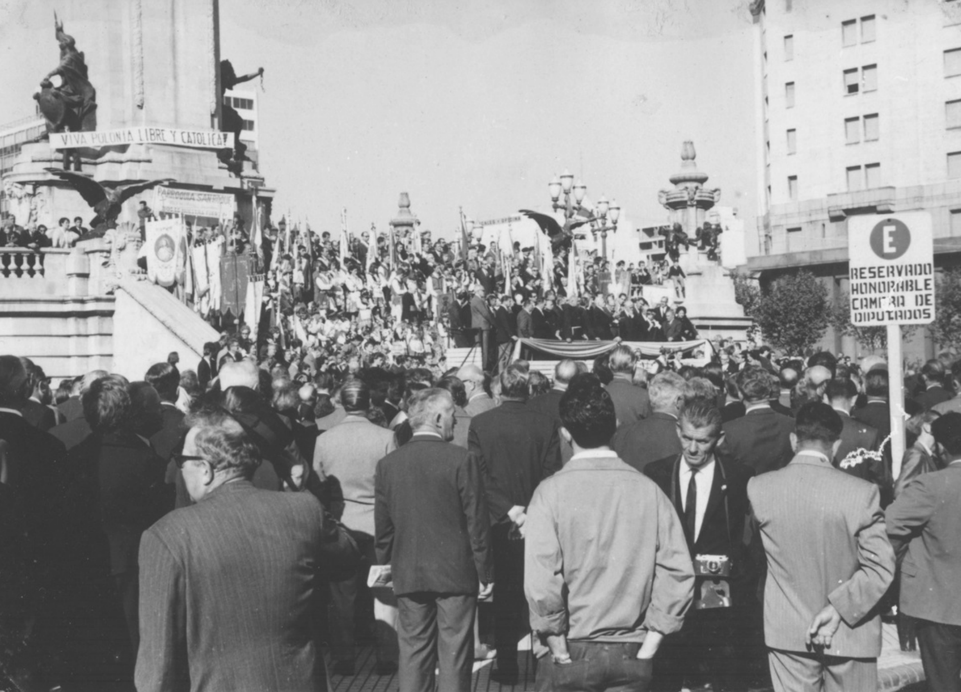
8 maja 1966, Buenos Aires. Obchody Tysiąclecia Chrztu i Państwa Polskiego na Plaza Congreso. U stóp pomnika odsłonięto z tej okazji tablicę pamiątkową. Na zdjęciu transparent "Viva Polonia libera i catolica" (Niech żyje wolna i katolicka Polska).