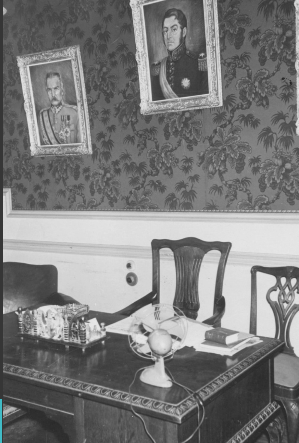
Brak daty, Buenos Aires. Dom Polski, siedziba wielu polskich organizacji. Na ścianie widać portrety Józefa Piłsudskiego, gen. San Martina.