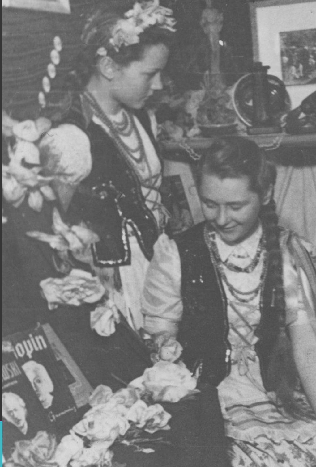
Brak daty, Buenos Aires. Kiermasz zorganizowany przez Polaków.