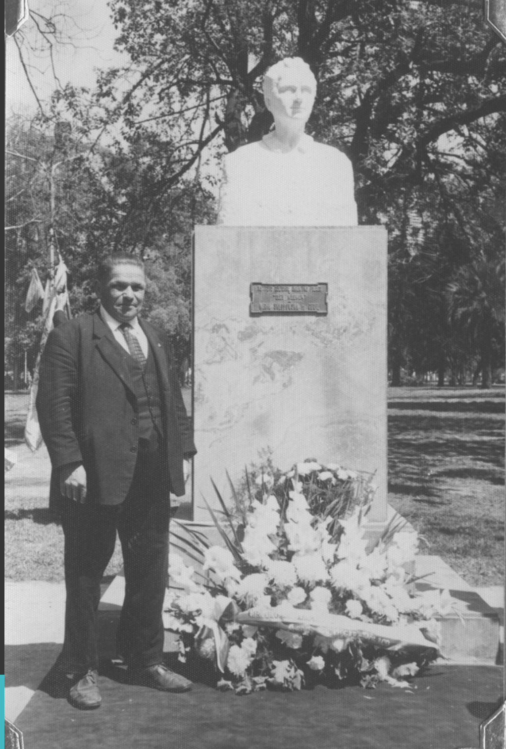
1967, Buenos Aires. Nieznany mężczyzna przy pomniku Marii Skłodowskiej-Curie w parku Centenario.

Polska społeczność chętnie upamiętniała zasłużonych Polaków. W 1967 w Buenos Aires odsłonięto pomnik Marii Skłodowskiej-Curie.