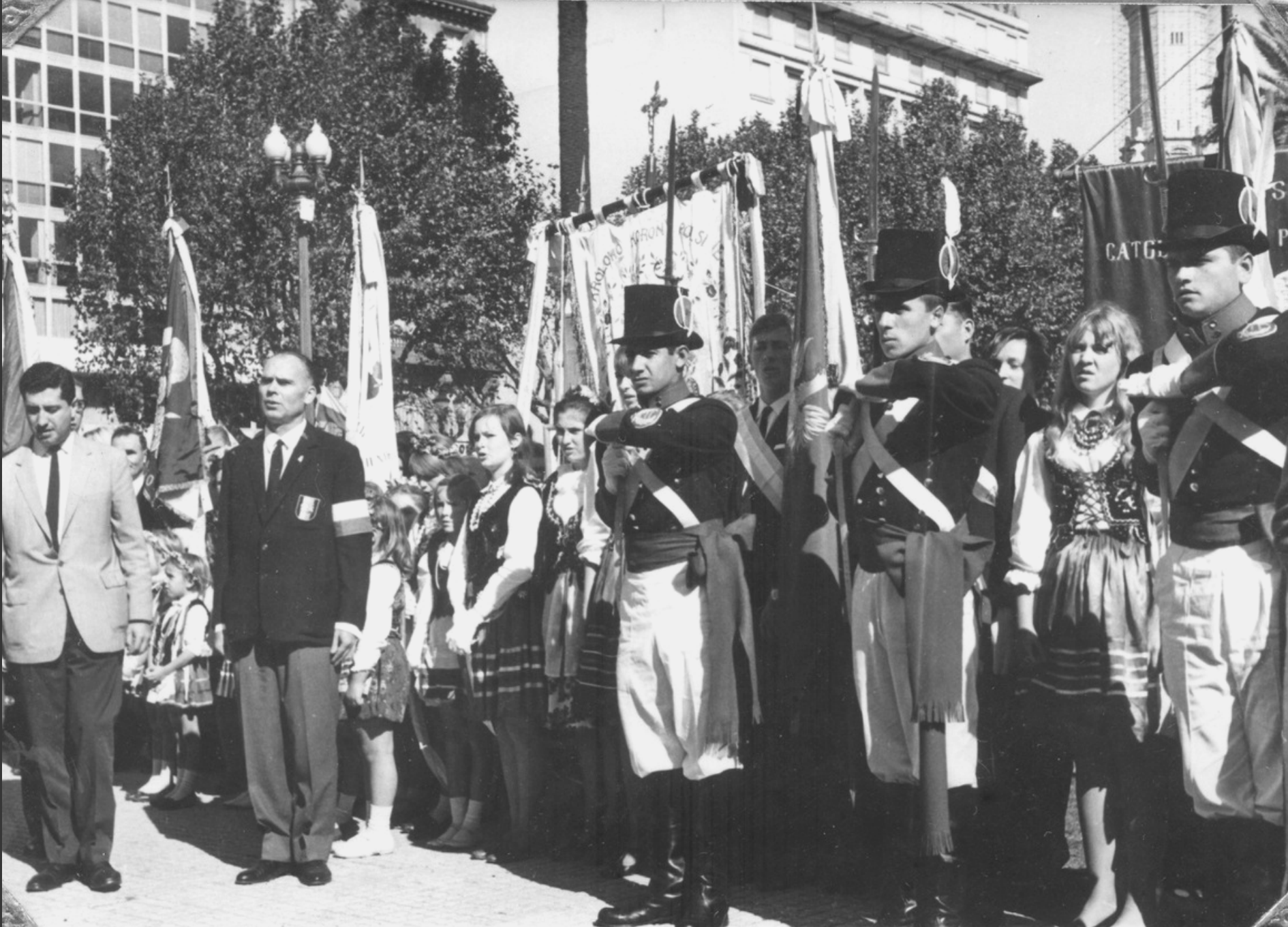
8 maja 1966, Buenos Aires. Obchody Tysiąclecia Chrztu i Państwa Polskiego. Na zdjęciu oddział żołnierzy pułku Patricios w mundurach historycznych.