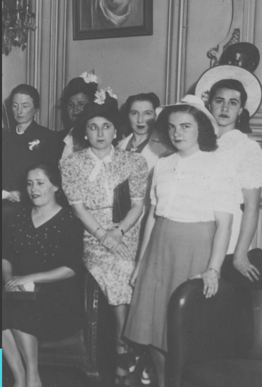
Lata 40. XX wieku, Buenos Aires. Członkinie Związku Kobiet Polskich.

Poselstwo II RP w Buenos Aires w połowie lat 30. XX w. szacowało liczbę emigrantów z ziem polskich na 200–250 tysięcy. Choć w Argentynie nazywano ich los polacos, byli wśród nich także Ukraińcy, Białorusini, Żydzi; mówili po polsku, ukraińsku, w jidysz; wyznawali katolicyzm, greko- katolicyzm, judaizm, prawosławie.