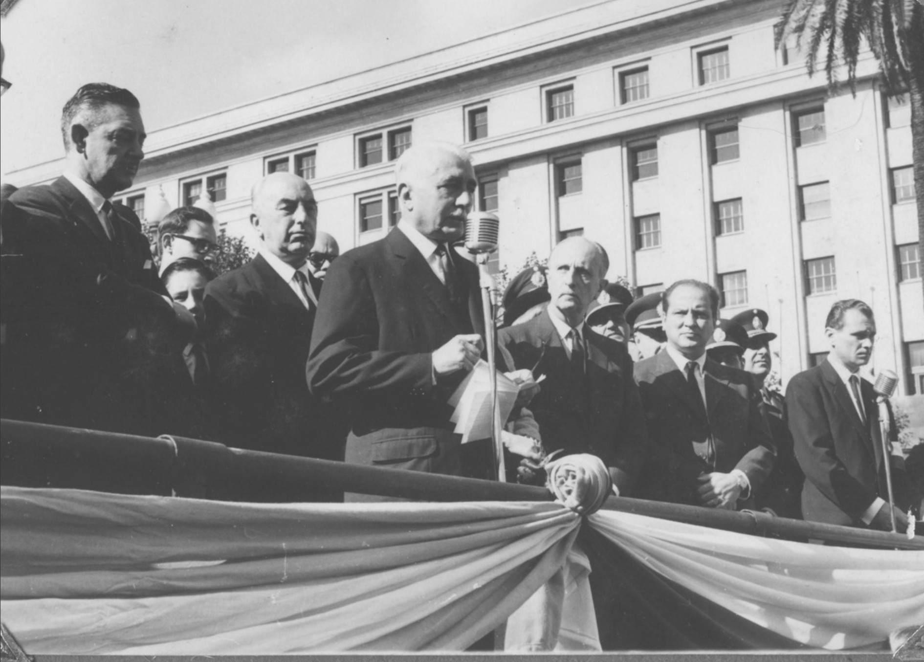
8 maja 1966, Buenos Aires. Obchody Tysiąclecia Chrztu i Państwa Polskiego. Trybuna na Plaza Congreso. Przemawia minister spraw wewnętrznych Argentyny Juan Palmero.