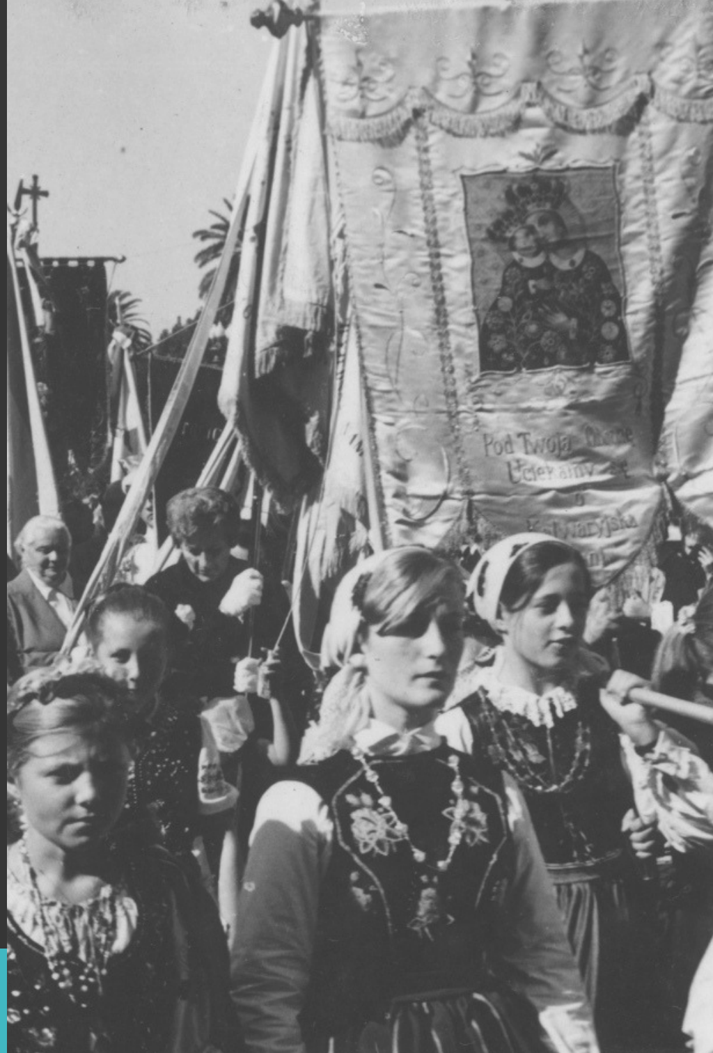
8 maja 1966, Buenos Aires. Obchody Tysiąclecia Chrztu i Państwa Polskiego. Na zdjęciu delegację polskich towarzystw ze sztandarami.

8 maja 1966 roku zorganizowano je w Buenos Aires. Do 8-tysięcznego tłumu na Plaza Congreso przemówił minister spraw wewnętrznych Juan Palmero. W katedrze mszę odprawił prymas Argentyny.