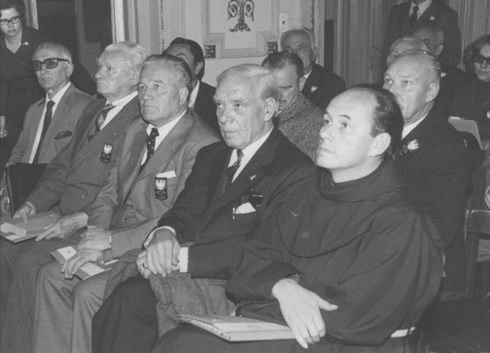
Czerwiec 1972, Buenos Aires. Obrady Sejmiku w Domu Polskim.